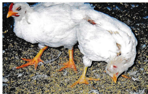
Нарушена стойка на тялото